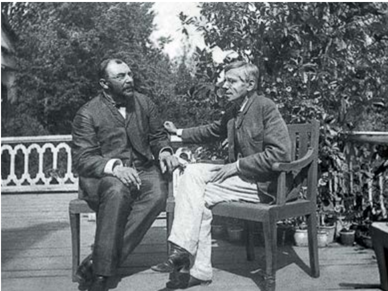
Сергей Александрович Рачинский