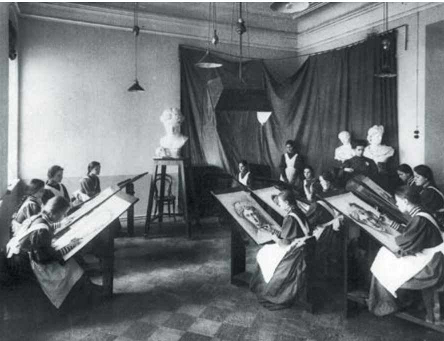
Занятие по рисованию с натуры в Свято-Владимирской женской церковно-учительской школе (слева)