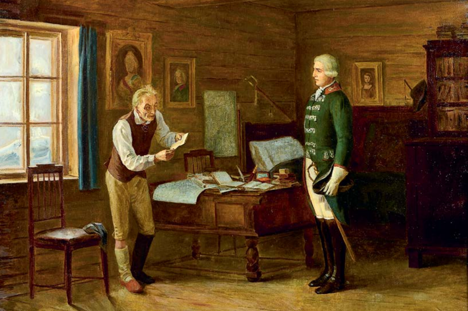
П. И. Геллер. Неожиданное послание Павла I к Суворову. 1902 г.

на морозе в одном мундире. В самые жесточайшие морозы, под Очаковым, Суворов на разводах был в одном супервесте, с каской на голове, а в торжественные дни в мундире и в шляпе, но всегда без перчаток. Плаща и сюртука не надевал в самый дождь» 22 .