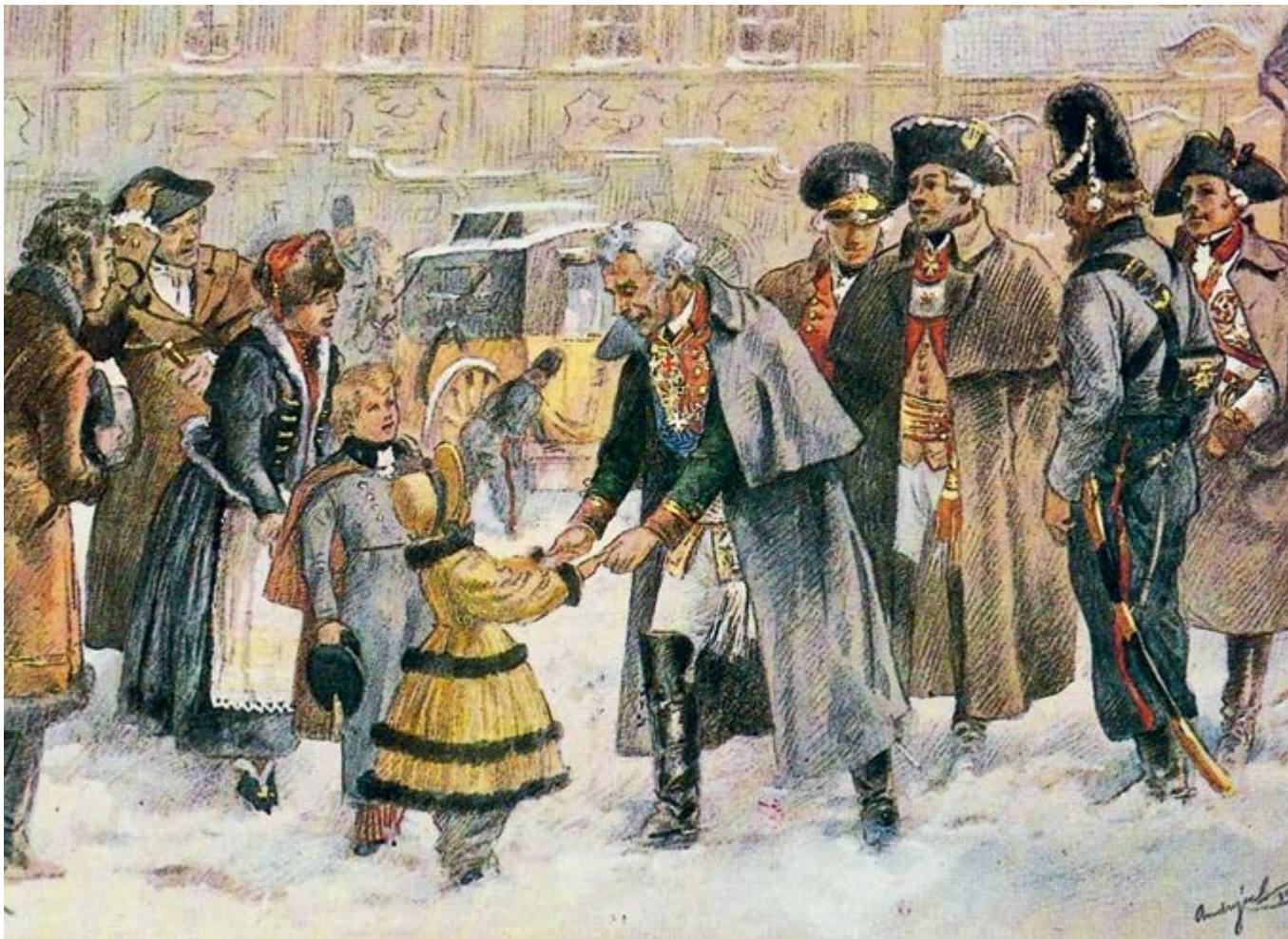
А. Андрысек. Суворов в городе Колин (Богемия). Середина XX в.

возвратился в Петербург Толбухин; прочитав привезенное от Суворова письмо, Государь приказал тотчас же отнести письмо к Императрице и сказать австрийскому послу Кобенцелю, что Суворов приезжает и что Венский двор может им располагать по желанию. На другой день приехал и Суворов» 42 .