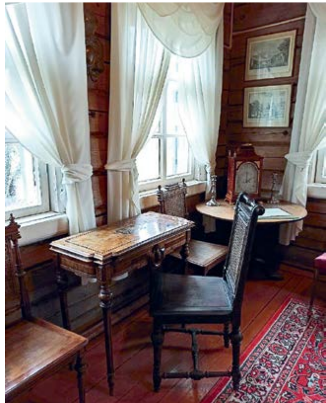
Музей-усадьба А. В. Суворова в селе Кончанское- Суворовское

Еще один рассказ: «Также не пропускал он ни одного случая показать пример уважения к закону, чистоте нравов, бескорыстию, твердости, мужеству, постоянству в трудах и деятельности военной: в сем случае предусмотрительность его доходила нередко до странности. Он был весьма набожен, без всякой примеси суеверия, но по-своему, как и во всем. Первое дело его, когда он просыпался, ночью или на рассвете, была молитва; ложась спать, он также молился, и очень долго. В церкви слушал он Божественную службу весьма внимательно, с великою набожностью, пел вместе с певчими и по обыкновению своему удивлялся очень много. Будучи сослан в деревню, имея более 70 лет, упражнял неутомимую деятельность своего характера над колоколами сельской церкви: он сам звонил к заутрене, к обедне и к вечерне...» 12