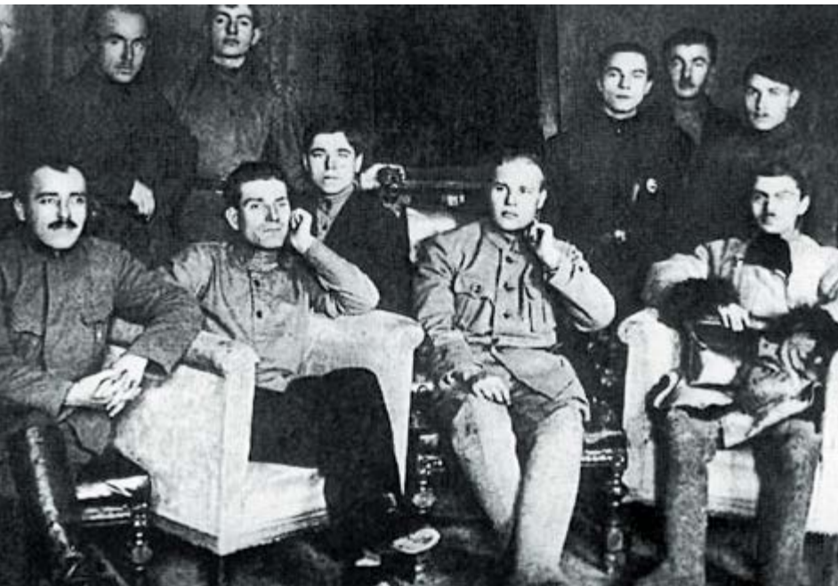
Сотрудники 6-го (антирелиги- озного) отде- ления СПО ОГПУ (слева)