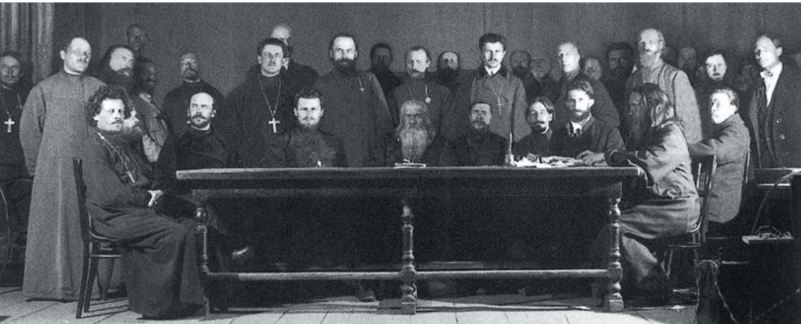
Президиум обновленческого собора. 1923 г.