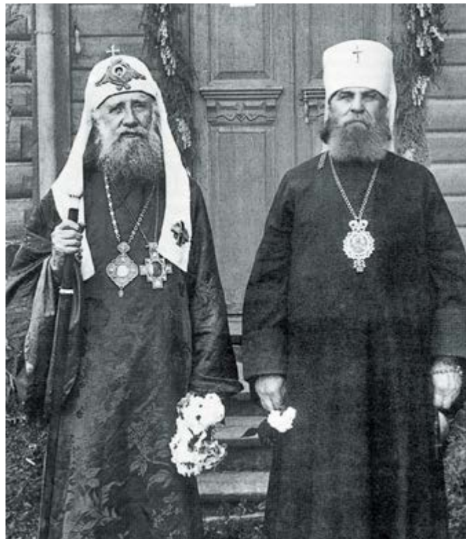
Патриарх Тихон и митрополит Петр (Полянский). 1923 г. (справа)

В условиях затянувшейся «провоочки» члены комиссии стали колебаться и в постановлении от 26 февраля 1924 года склонились к разрешению организации Патриаршего Синода, но лишь «при условии, если он введет в этот синод ряд лиц, хорошо ведомых ОГПУ» 18 . По иронии судьбы 26 февраля 1924 года и Политбюро ЦК РКП(б) утвердило наконец «антитихоновскую» инструкцию по проведению регистрации религиозных обществ.