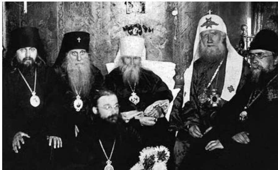
Патриарх Тихон в гостях у бывшего митрополита Московского и Коломенского Макария (Невского) в Николо-Угрешском монастыре (вверху)

В июльскую редакцию инструкции 1923 года члены АРК включили в перечень условий отказа в регистрации религиозной общины объединение верующих «около лица, лишенного права или состоящего под судом и следствием» 15 , что формально отнимало у Патриарха возможность возглавить верные православию приходы. Между тем в процессе дальнейшей правки инструкции со стороны Народного комиссариата юстиции и НКВД выявилась ущербность данного условия, ведь неизбежная регистрация безусловного большинства религиозных обществ России в этом случае могла стать объективной причиной для прекращения следствия против Патриарха. Выход нашли в замене проблемного условия регистрации на новое: списки членов новых общин должны иметь обязательное заверение у существующих епархиальных управлений, которые де-факто являлись учреждениями раскольничьего «Синода» 16 . Таким образом, к будущей радости раскольников, для них был